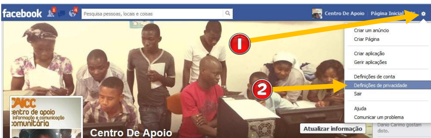
Imagem 2 – Aceder a definições de privacidade