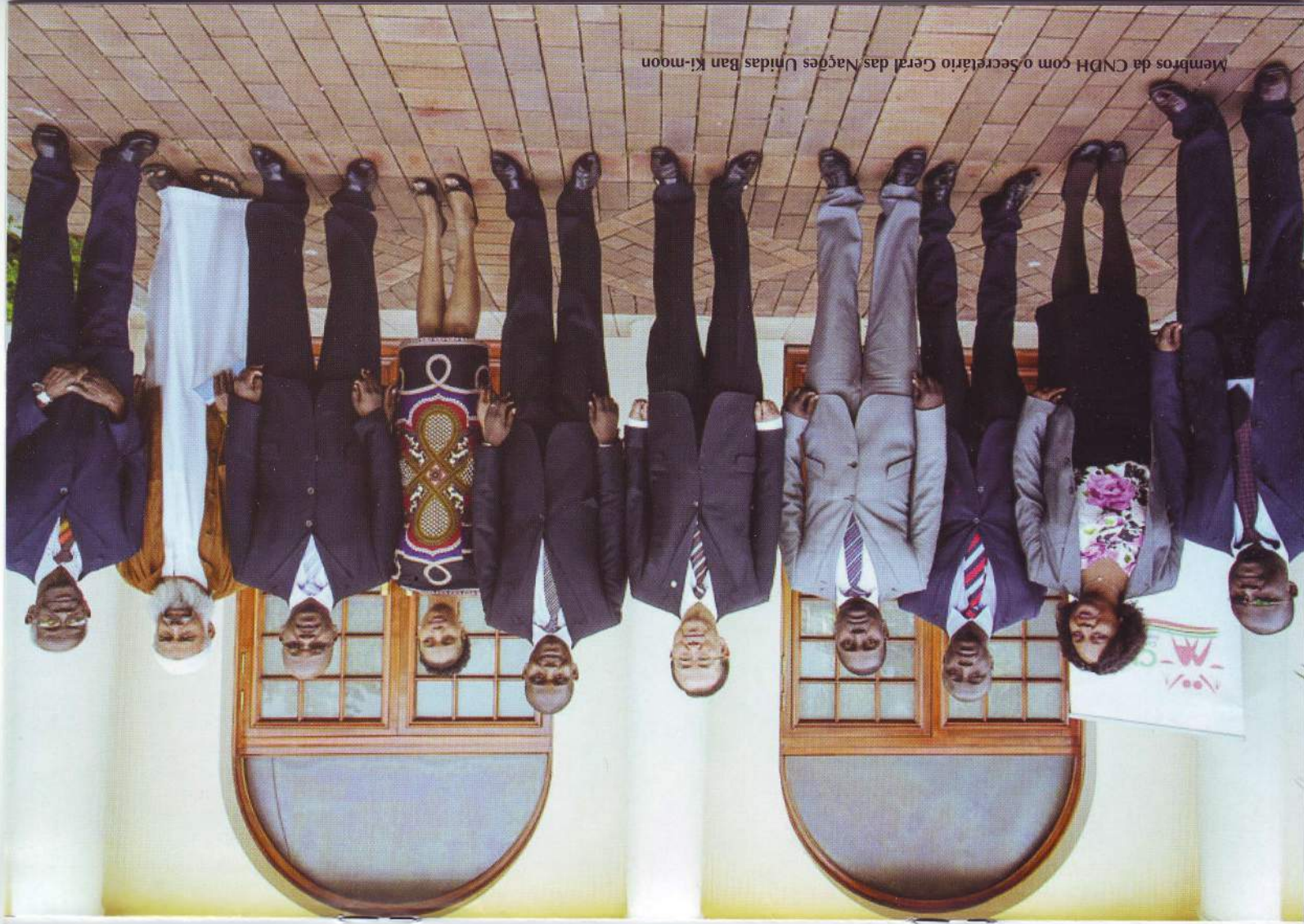
Membros da CNDH com o Secretário Geral das Nações Unidas Ban Ki-moon

A Comissão Nacional dos Direitos Humanos aprova o seu balanço de actividades e contas nos primeiros trinta dias de cada ano civil.