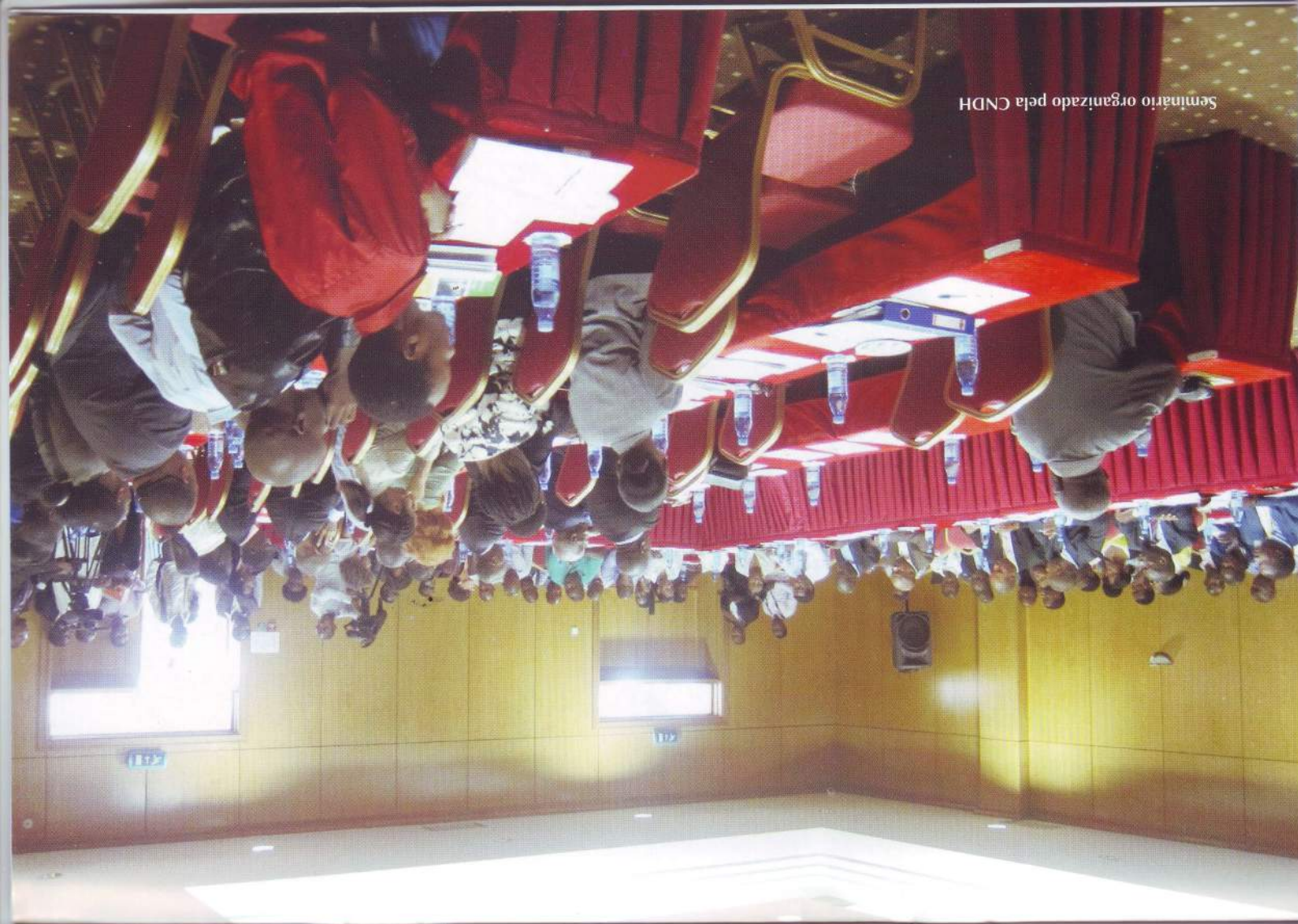
Seminário organizado pela CNDH