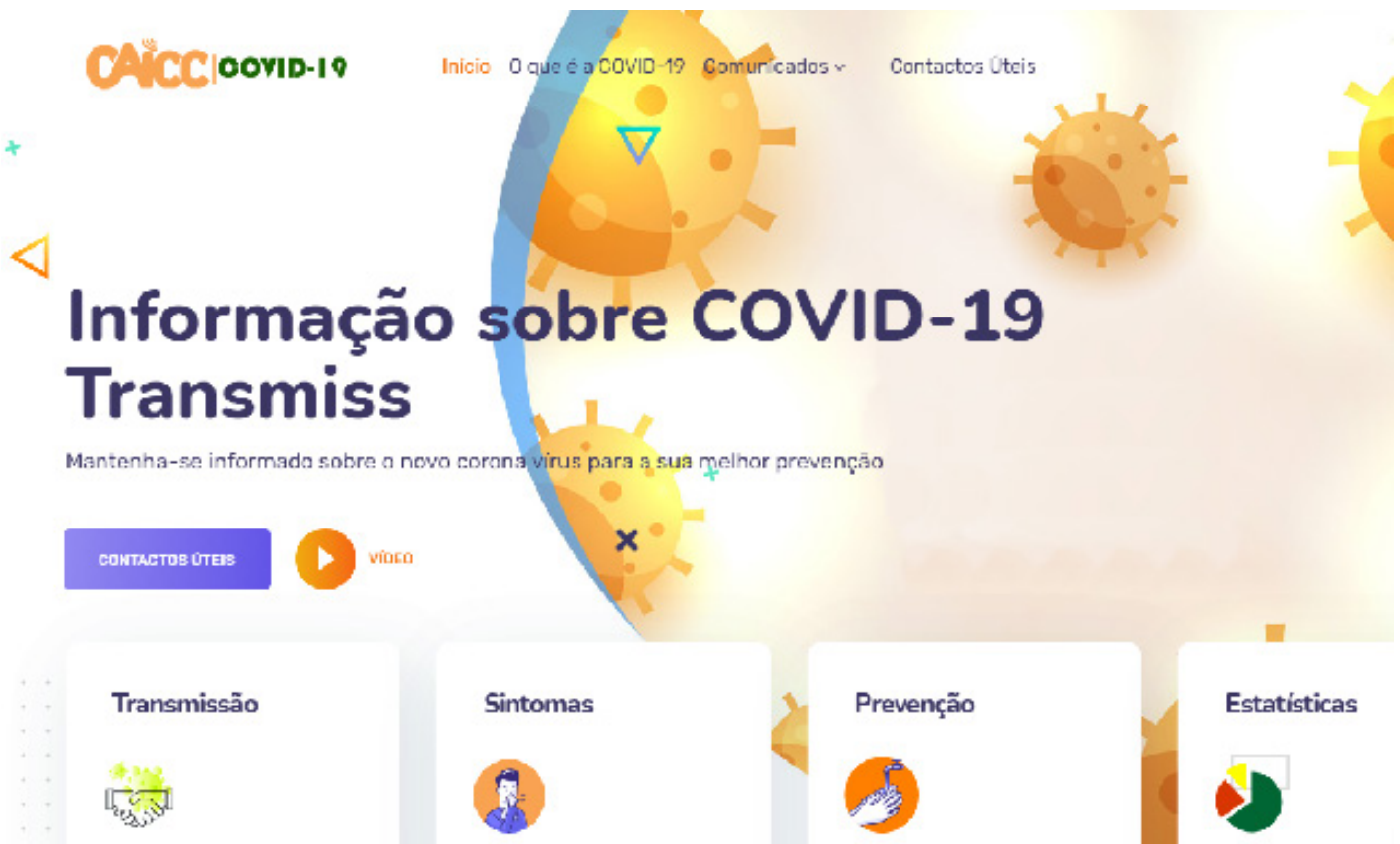
Painel da pagina da covid19 do CAICC

Com o surgimento da COVID-19, surgiu a necessidade de criar um espaço para partilha de informação e esclarecimento de dúvidas em linguagem "simples" ligadas ao novo coronavírus. No sentido de colmatar esta lacuna o CAICC decidiu aumentar os seus canais de comunicação com a criação em Junho de 2020 de uma página web dedicada as informações ligadas a COVID-19, denominada CAICC COVID19.