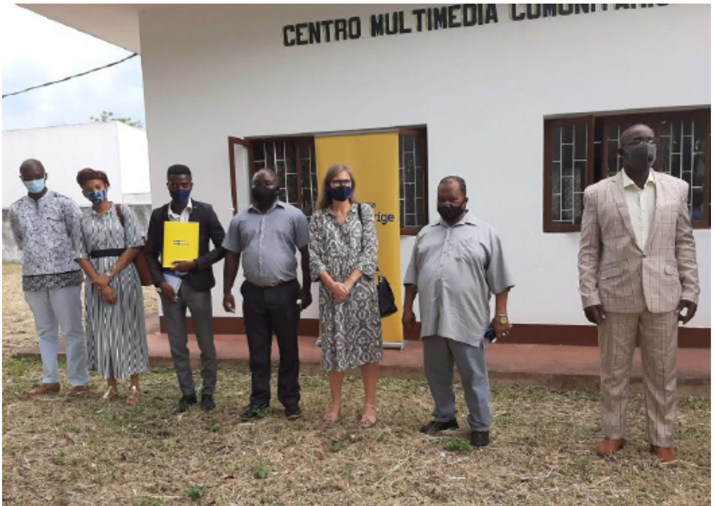
Foto de família entrega de equipamento na Rádio Nkomati-Manhiça

Refira-se que até finais de Fevereiro de 2021 serão abrangidas todas as 23 rádios selecionadas representando as províncias de Niassa, Cabo-Delgado, Nampula, Zambézia, Tete, Sofala, Manica e Maputo.