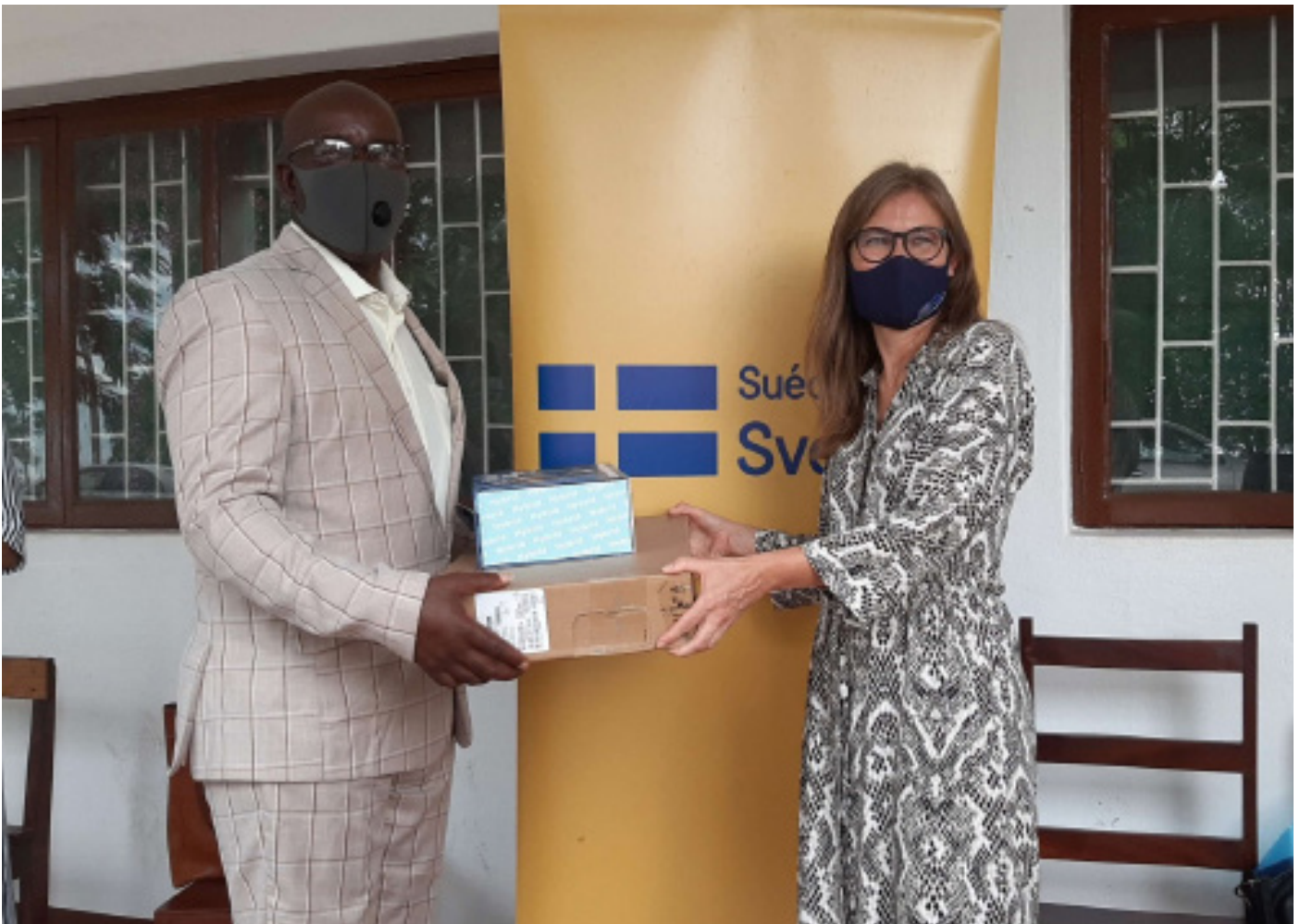
Acto de entrega de equipamento pela embaixadora da Suécia em Moçambique

O apoio é financiado pela Embaixada da Suécia e implementado pelo Programa Acções para uma Governação Inclusiva e Responsável (AGIR) em coordenação com o Centro de Apoio À Informação e Comunicação Comunitária (CAICC) e visa alcançar um total de 23 rádios comunitárias do país. No dia 15 de Dezembro, foi lançado o primeiro acto