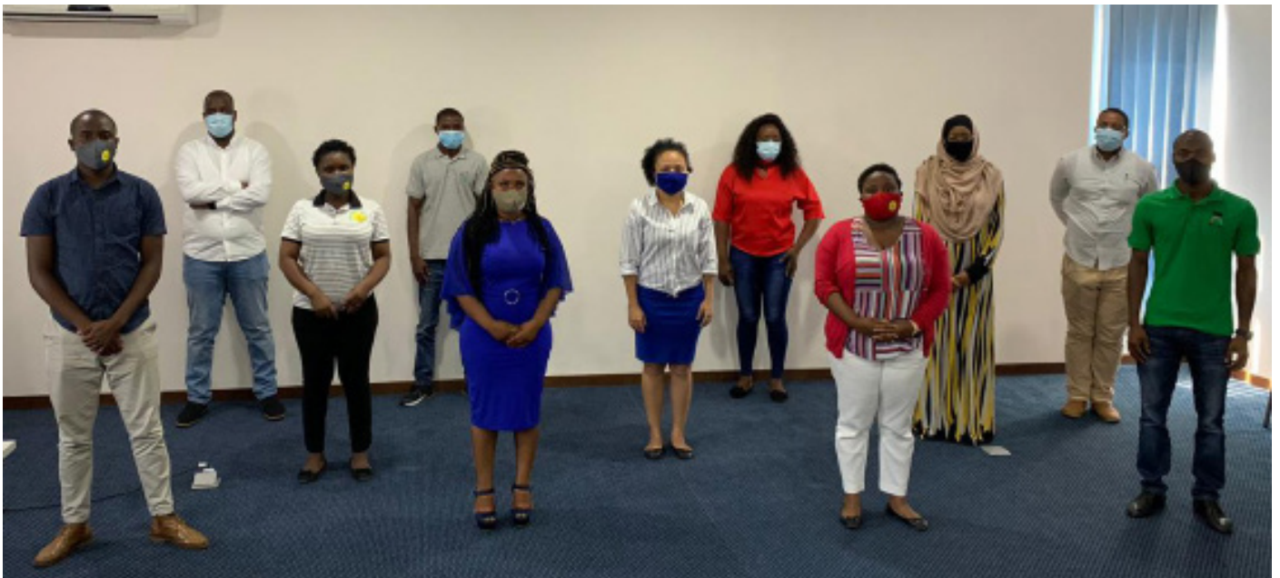
Foto de família na Reunião sobre Salvaguarda

Trata-se de um treinamento que decorreu de 15 a 17 de Novembro na cidade de Maputo e tinha como objectivos: Consciencializar os participantes acerca da Protecção contra Assédio, Abuso e Exploração Sexual (PSEA) tanto nas organizações bem como nos beneficiários destas.