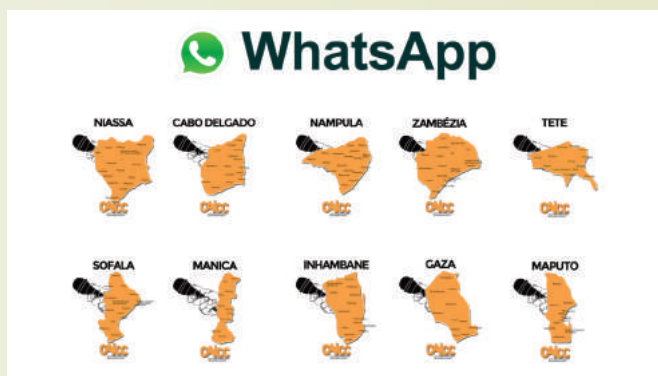
Grupos Provincias de WhatsApp das Rádios Comunitárias de Moçambique

O CAICC – Centro de apoio a Informação e Comunicação Comunitária criou em Outubro de 2015, grupos do WhatsApp para comunicadores das rádios comunitárias e centros multimédia das províncias de M o ç a m b i q u e . Estes grupos têm sido uma plataforma de diálogo, debate de ideias e partilha de novidades entre os comunicadores. Por dia, são feitos em cada um dos 10 grupos provinciais, cerca de 10 publicações que levantam debates que chegam a atingir 20 a 30 mensagens patilhas num grupo, o que significa que no total, os grupos provinciais partilham entre 200 a 300 mensagens por dia. Cada comunicador publica uma foto, vídeo ou texto que retrata situações que estejam a acontecer no distrito ou comunidade onde a sua rádio está inserida e ele esteja a trabalhar. Trata-se de uma abordagem de uma comunicação moderna que usa as redes sociais como plataformas de divulgação de informação, partilha de conhecimento e participação democrática. Com os grupos do WhatsApp os comunicadores passaram a estar mais próximos entre si o que faz com que a sua parceria tenha mais significado e produza efeitos duradouros em função do conhecimento que cada um tem do outro.