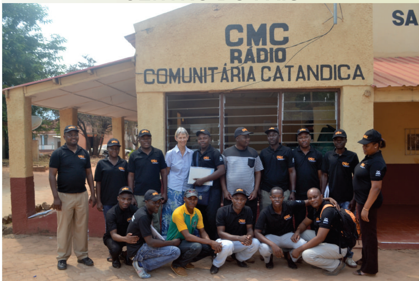
Participantes do workshop de lançamento do projecto cara-a-cara, em Catandica

O CAICC (Centro de Apoio à Informação e Comunicação comunitária) lançou em Outubro último no CMC de Catandica, na província de Manica, o projecto Cara-a-Cara .