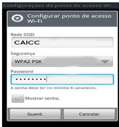
Imagem 3 – Partilhando a Internet

Todos os dados acima referidos podem ser vistos na imagem 3.