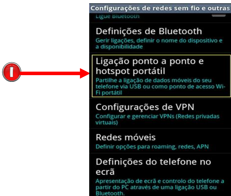
Imagem 1 – Aceder Configurações do Celular

Vai ao menu principal no seu celular Android e toque no ícone "Configurações". A seguir, toque em "Mais configurações" para depois ir até às configurações de redes sem fios e outras e em seguida escolher a opção Ligação ponto a ponto e hotspot portátil sem fios . Veja número 1, na imagem 1.