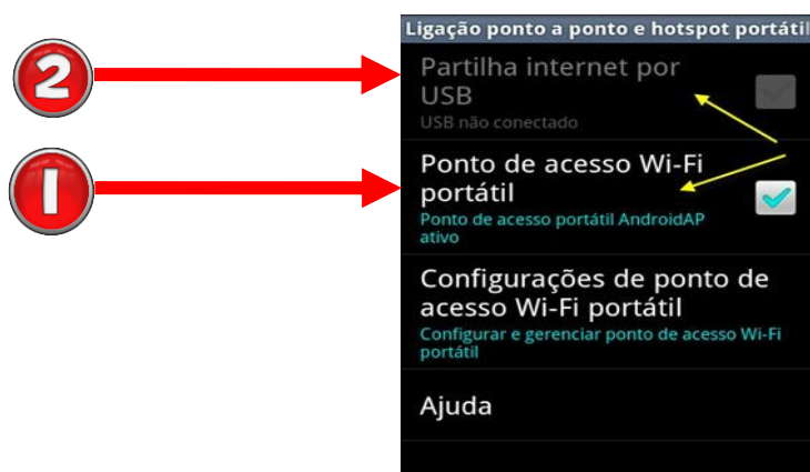
Imagem 2 – Escolher tipo de partilha de internet

NOTA: Uma opção alternativa é a partilha da ligação via cabo USB. Nesse caso deve escolher a opção Partilhar internet por USB indicado pelo número 2 na mesma imagem.