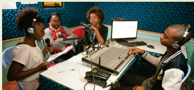
Colaboradores da Rádio Maxaquene (Maputo) em plena emissão

prestação de contas, género e saúde, bem como demonstram necessidade de incorporar o uso de TIC na produção de programas virados a participação da comunidade, reduzindo de certo modo as distâncias que os repórteres deviam percorrer para colher as sensibilidades da comunidade, através de gravação de entrevistas curtas.