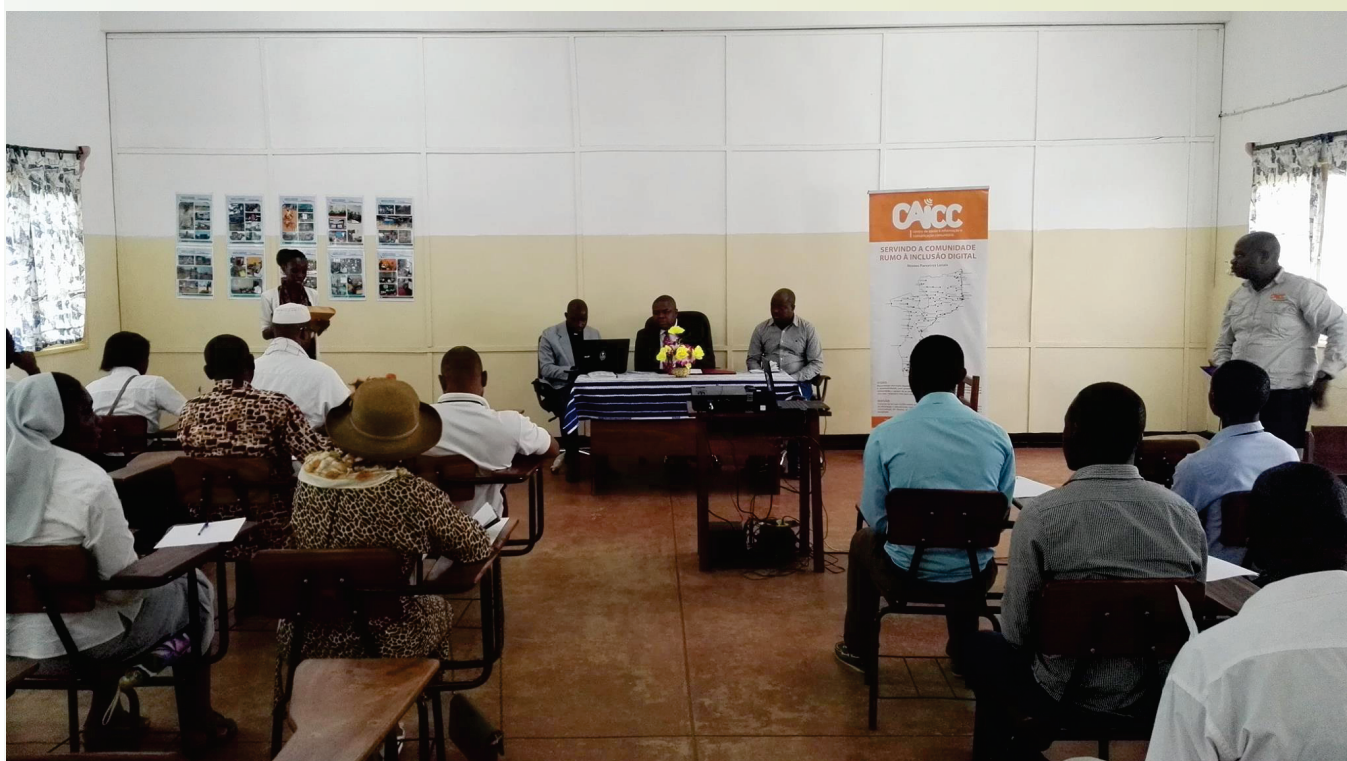
Participantes do workshop organizado pelo CAICC em Pemba (Cabo Delgado)

O CAICC – Centro de Apoio à Informação e Comunicação Comunitária realizou na província de Cabo Delgado, em Março, os seus dois primeiros workshops distritais do ano de 2017 sobre o uso de tecnologias de informação e comunicação para o desenvolvimento distrital, tendo juntado representantes de instituições públicas, académicos, líderes comunitários, organizações da sociedade civil, políticos, religiosos e agentes económicos dos distritos de Palma (norte da província) e Pemba (capital provincial) tendo como mote, o incentivo à sociedade a catalisar os debates nas rádios comunitárias e centros multimédia que constituem centros de promoção de TIC a nível