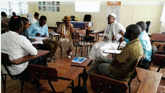
Participantes de workshop debatem em grupo

colaborar com a mesma para que consiga cumprir o seu papel de garantir que os cidadãos tenham acesso a informação sobre o distrito, particularmente os mega-projectos e o seu impacto social. Os participantes do workshop defendem que as notícias, debates públicos, e outras informações relevantes a ser divulgadas pela rádio deverão contribuir para a promoção do desenvolvimento do distrito, quando forem acomodadas as opiniões de todos os cidadãos do distrito na sua programação. De referir que o governo local e o ICS estão num processo avançado para a instalação da rádio.