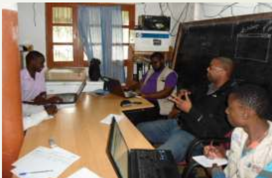
Equipa (IREX-CAICC) trabalhando em Balama

Uma equipa constituída por técnicos da IREX e CAICC visitou em Março último as rádios comunitárias de Balama, Mueda e Nangololo (Cabo Delgado), Nacala (Nampula) Quelimane Fm e Morrumbala (Zambézia), para diagnosticar aquelas que poderão vir a ser consideradas rádios-modelo.