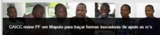
CAICC reúne PF em Maputo para traçar formas inovadoras de apoio as rc's